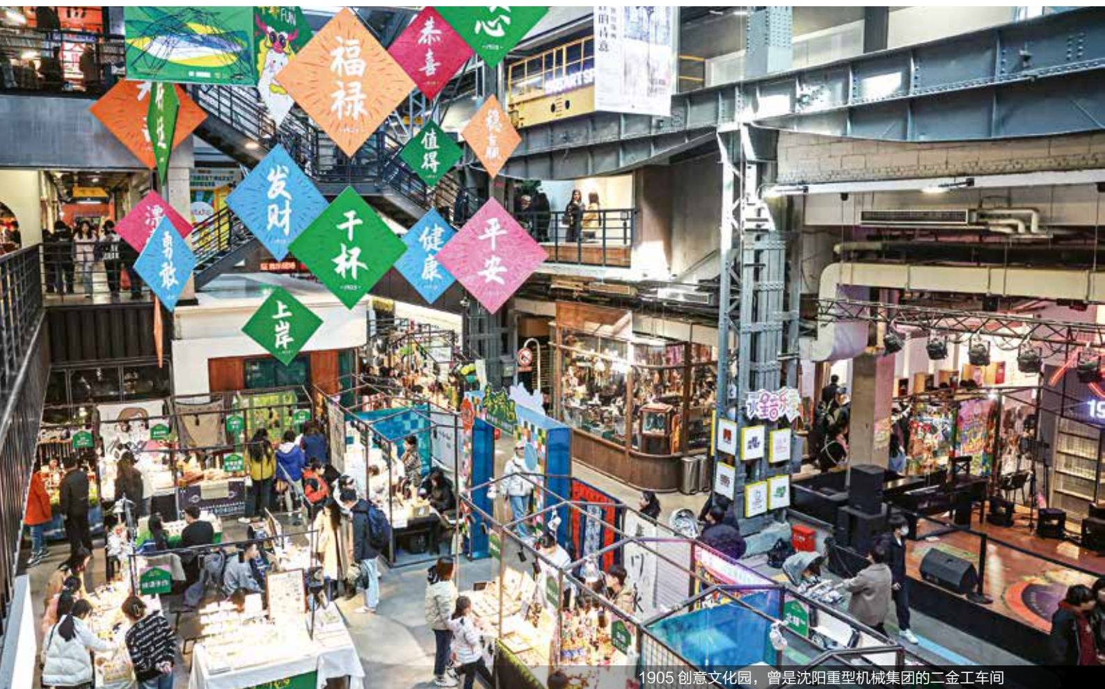
1905 创意文化园，曾是沈阳重型机械集团的二金车间

8月中旬，趁着巴黎奥运的热度，沈阳铁西区所有的工厂工人之间组织了一场大型篮球比赛——“振兴杯”2024铁西区首届“厂BA”篮球赛决赛。本届篮球赛有32支厂队、65场比赛，共计持续57天，这也是迄今为止第一场大规模工厂工人集体参加的篮球赛事。#铁西厂BA#冲上热搜。