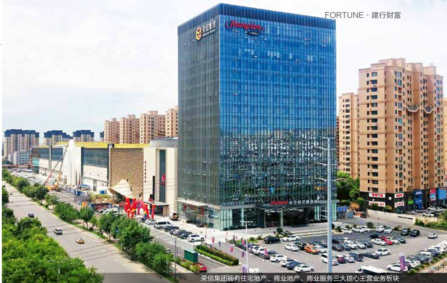
荣信集团拥有住宅地产、商业地产、商业服务三大核心主营业务板块