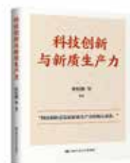
《科技创新与新质生产力》