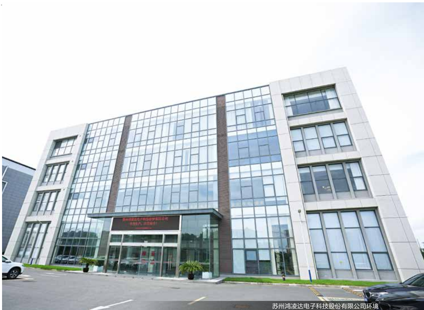
苏州鸿凌达电子科技股份有限公司环境