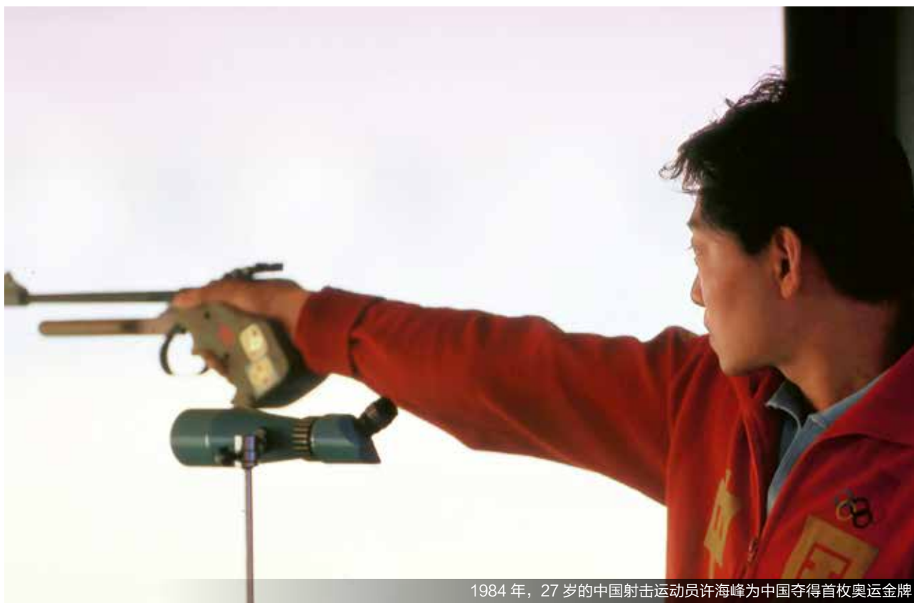
1984年，27岁的中国射击运动员许海峰为中国夺得首枚奥运金牌

随着巴黎的夜幕渐渐降临，当地时间8月11日，第33届夏季奥林匹克运动会在璀璨的烟火中落下帷幕。