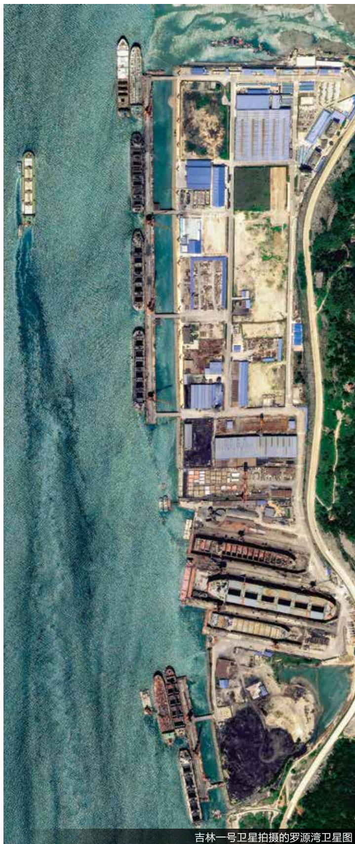
吉林一号卫星拍摄的罗源湾卫星图