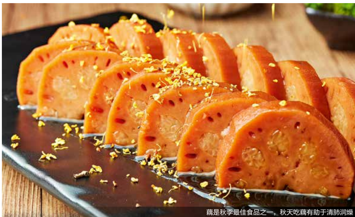
藕是秋季最佳食品之一，秋天吃藕有助于清肺润燥

三候水始涸。天渐寒，雨渐少。在秋分的最后一候，气候逐渐干燥，阳气衰则水涸。自此之后，河流和湖泊的水位开始逐渐下降，大地开始显现出一种干涸的景象。值得注意的是，水的减少，也意味着