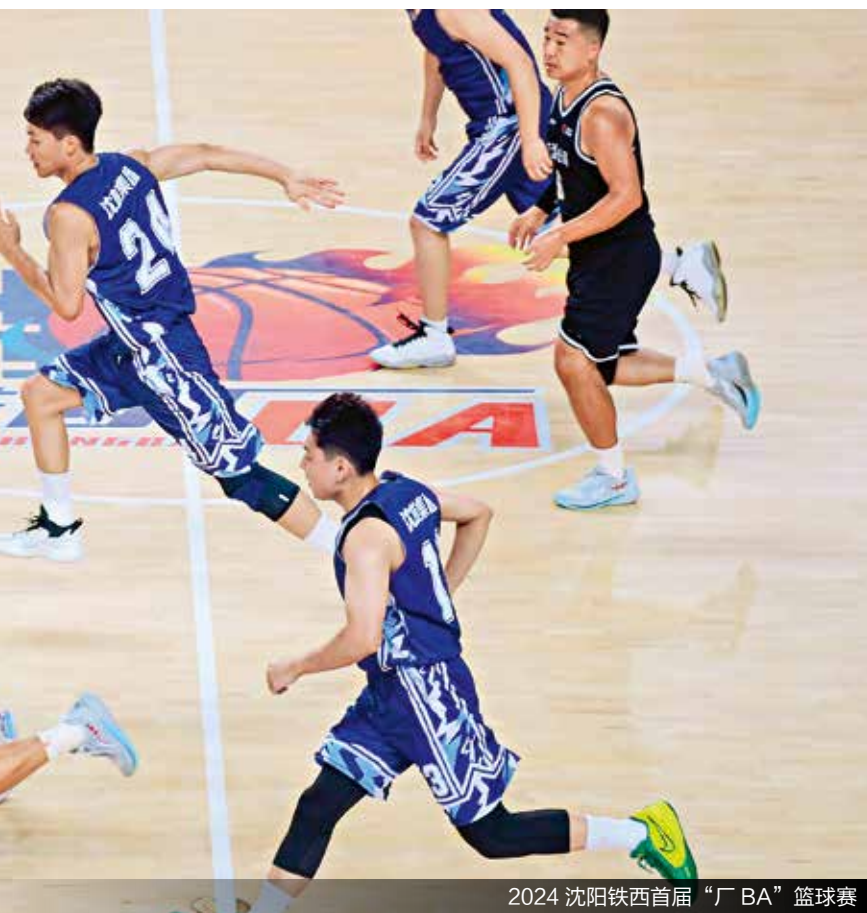
2024 沈阳铁西首届“厂BA”篮球赛

在这个过程中，沈阳并没有忘记那些见证过辉煌岁月的老工业区。相反，沈阳让这些老工业区焕发出了新的生机与活力。既保留了工业文脉和城市记忆，又为城市发展注入了新的活力。☞