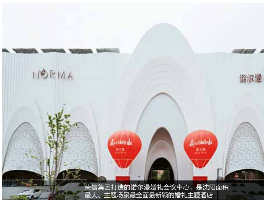
荣信集团打造的诺尔漫婚礼会议中心，是沈阳面积最大、主题场景最全面最新颖的婚礼主题酒店