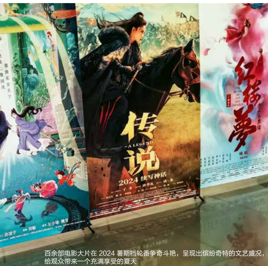
百余部电影大片在 2024 暑期档轮番争奇斗艳，呈现出缤纷奇特的文艺盛况，给观众带来一个充满享受的夏天

今年暑期档也引进了不少海外经典 IP，包括《神偷奶爸4》《加菲猫家族》《头脑特工队2》《阿狸》《航海王：强者天下》，重映的《灌篮高手》和《你的名字。》、漫威大片《死侍与金刚狼》等。