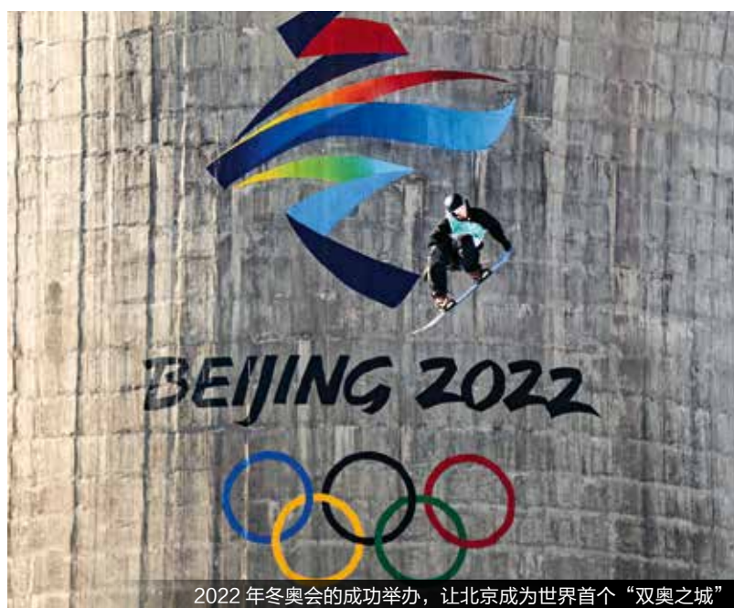
2022 年冬奥会的成功举办，让北京成为世界首个“双奥之城”