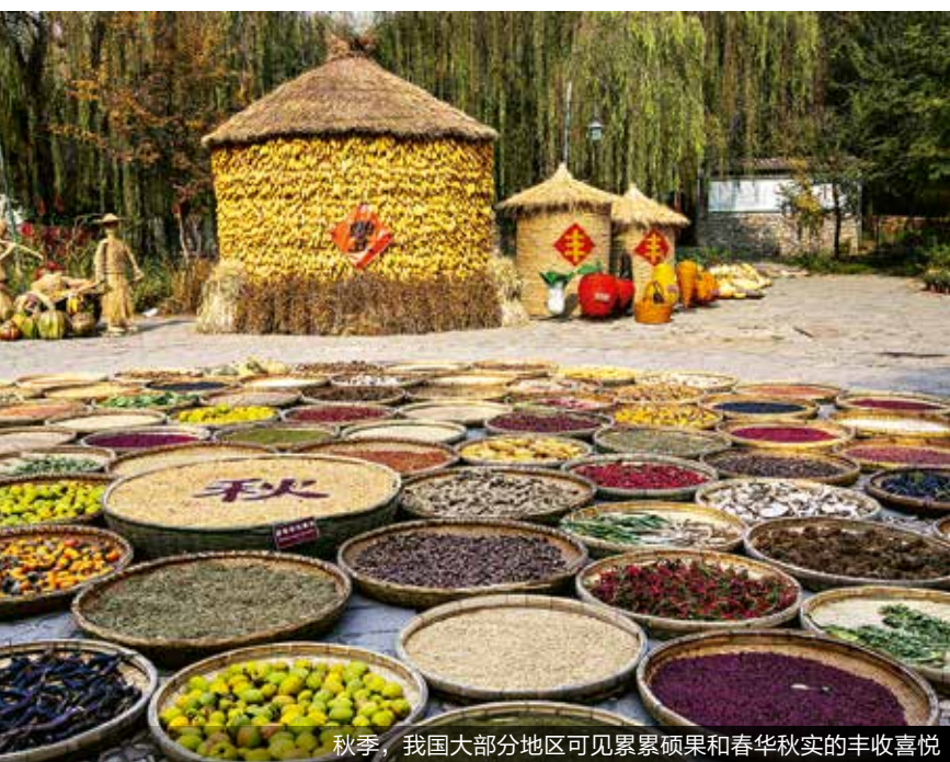
秋季，我国大部分地区可见累累硕果和春华秋实的丰收喜悦