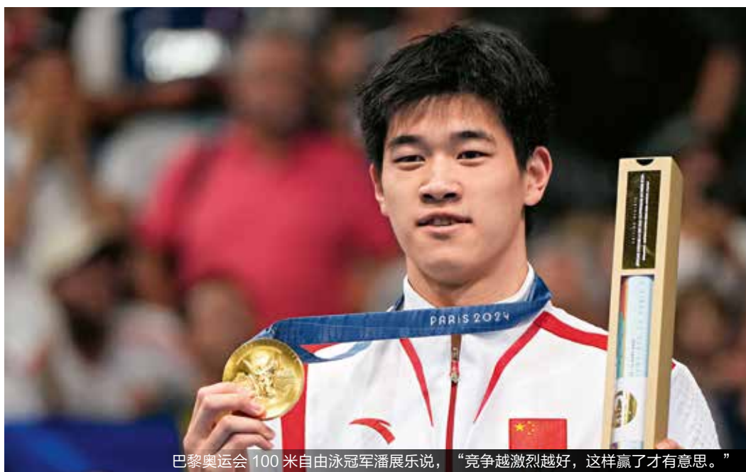
巴黎奥运会 100 米自由泳冠军潘展乐说，“竞争越激烈越好，这样赢了才有意思。”

郑钦文在巴黎奥运会网球女单决赛中的鏖战，让其“Queen Wen”称号迅速刷屏西方媒体，郑钦文在获得网球女单冠军后说：“这个胜利对我无可比拟，独一无二……因为在我的心中，国家的荣誉要