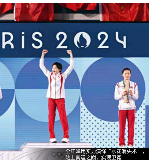
全红婵用实力演绎“水花消失术”，站上奥运之巅，实现卫冕