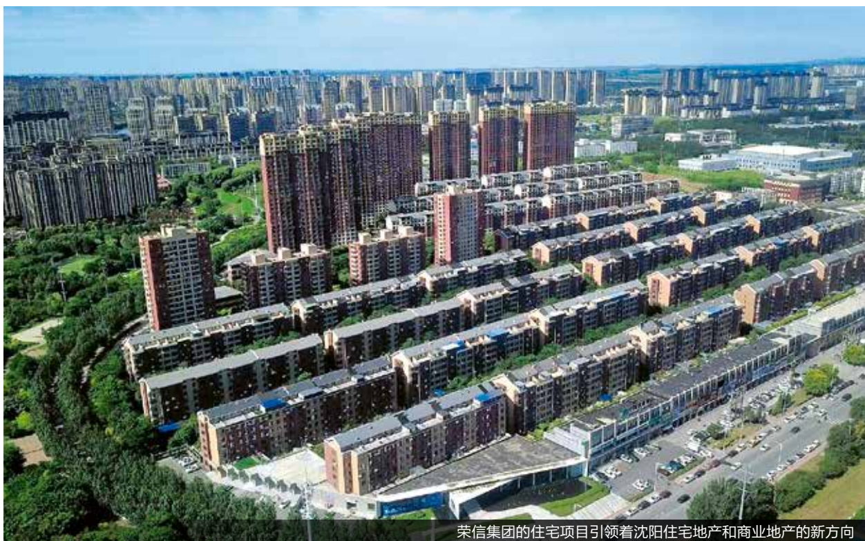
荣信集团的住宅项目引领着沈阳住宅地产和商业地产的新方向

2009 年，依托沈阳蒲河新城的唯一核心商业街“人和街”，人和万象商场商业正式亮相，该项目采用了目前便民商业“1+3”最完美的业态组合方式，将超市、农贸市场、轻工市场、时尚步行街有机地组合在一起，为蒲河新城人民休闲、娱乐、