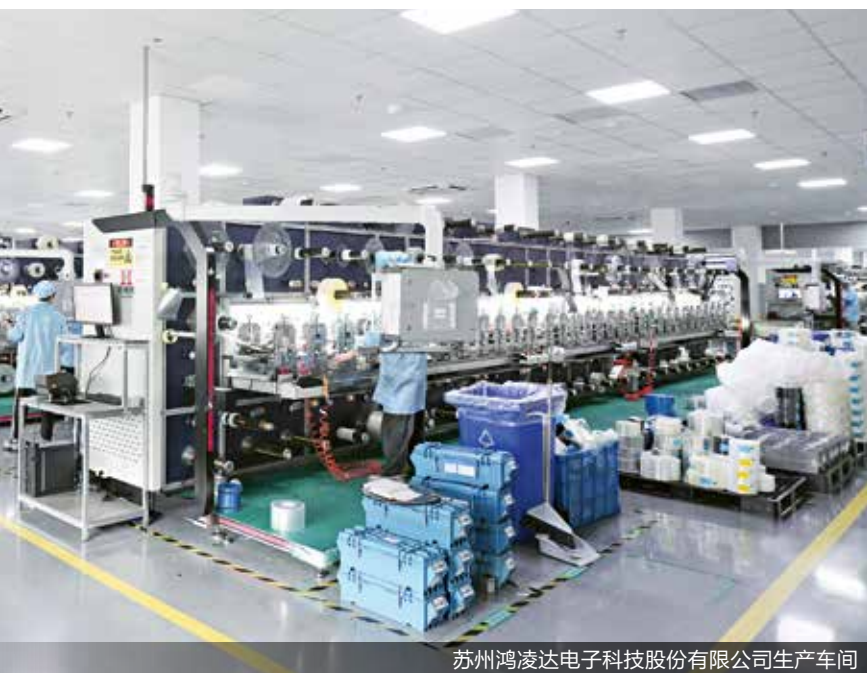
苏州鸿凌达电子科技有限公司生产车间

2019年开始，鸿凌达在超厚PI膜（聚酰亚胺膜，简称PI）制作高性能石墨领域发力，经过近两年的技术攻关，终于实现了单层厚度70um，导热系数 >1500\text{W}/(\text{m}\cdot\text{K}) 的高功率石墨膜材料。突破了传统工艺单层厚度 <40\text{um} ，导热性能 <1000\text{W}/(\text{m}\cdot\text{K}) 的性能瓶颈，此项技术突破也获得了著名炭材料科学家、中