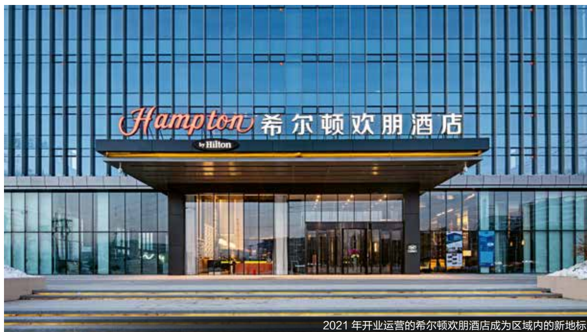
2021年开业运营的希尔顿欢朋酒店成为区域内的新地标